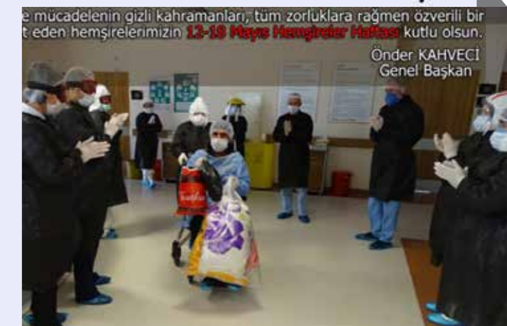
"Eğilimlerin gizli kahramanları, tüm zorluklara rağmen özverili bir şekilde hizmet eden hemşirelerimizin 12-18 Mayıs Hemşireler Haftasını kutlu olsun." Önder KAHVECİ Genel Başkan

fiziki/sözlü şiddete uğrama ve kreş sorunu gibi öncelikli ve ivedilikle çözülmesi gereken sorunları bulunmaktadır. Hemşire arkadaşlarımızın alın terinin karşılığı verilmeli, sorunları çözümlenmelidir. Bu temennilerle koronavirüsle mücadelede Türkiye'nin dört bir yanında şifa dağıtan, Çalışma hayatındaki tüm zorluklara ve yaşanan tüm olumsuzluklara rağmen özverili bir şekilde hizmet eden gizli kahramanlar hemşirelerimizin, 12-18 Mayıs Hemşireler Haftasını kutluyorum. Yaşamlarında başarı ve mutlulukların onlarla olmasını diliyorum." dedi.