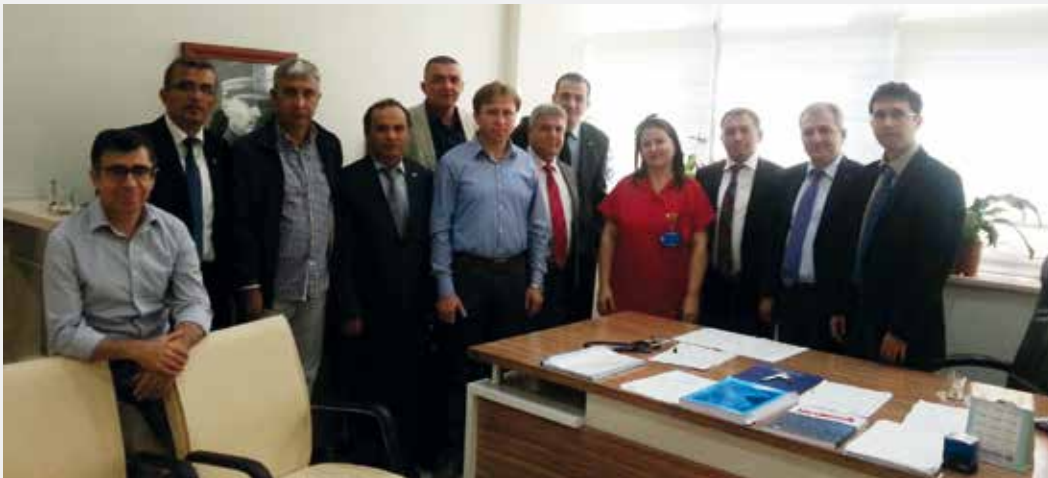
Balıkesir'de ayrıca kurum ziyaretleri yapılarak çalışanlarla da bir araya gelindi.

bölücü terör azdırıldı ve palazlanmasına müsaade edildi. Türkiye Kamu-Sen olarak teröre karşı tepkimizi dün de göstermiş ve bu süreçlerin yanlışlığını ifade etmiştik. Bugün de teröre tepki konusunda yine örnek STK olduk. Eylemlerimiz ve çalışmalarımız ile milletimizin duygularına yine biz tercüman olduk" dedi.