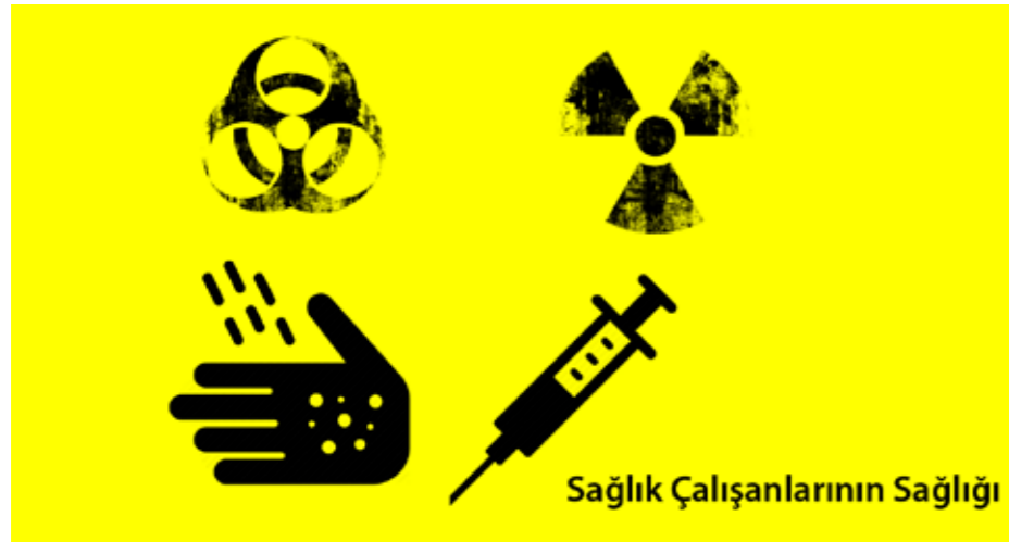
Sağlık Çalışanlarının Sağlığı

Açtığımız dava sonucunda mahkeme kamuda iş sağlığı ve güvenliği uzmanı çalıştırma zorunluluğunun ertelenmesi nedeniyle kamuda bu alanda görevlendirilen personele ücret ödenmemesi işlemi hukuka aykırı bularak iptal etti.