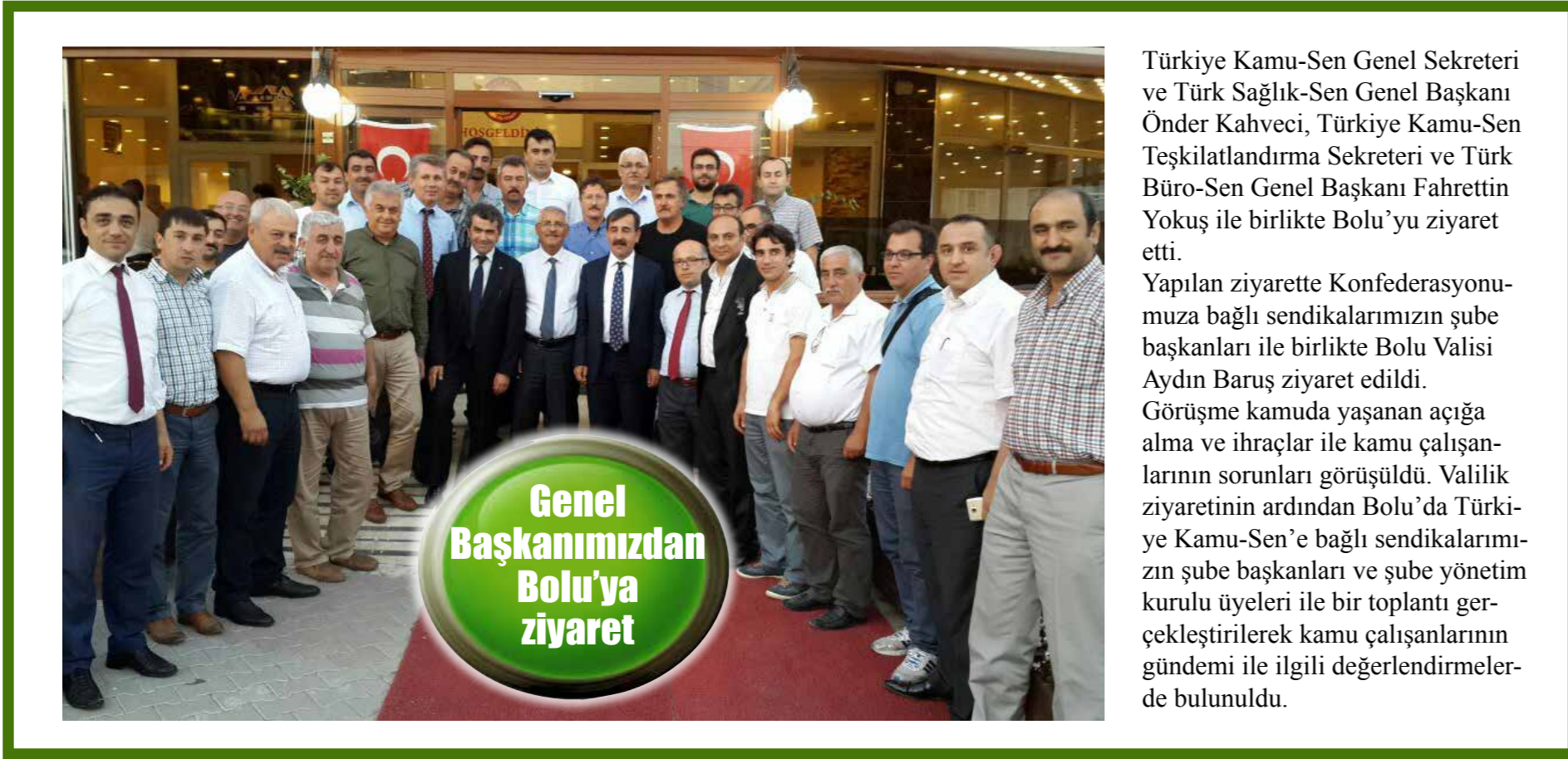
Genel Başkanımızdan Bolu'ya ziyaret

Türkiye Kamu-Sen Genel Sekreteri ve Türk Sağlık-Sen Genel Başkanı Önder Kahveci, Türkiye Kamu-Sen Teşkilatlandırma Sekreteri ve Türk Büro-Sen Genel Başkanı Fahrettin Yokuş ile birlikte Bolu'yu ziyaret etti. Yapılan ziyarette Konfederasyonumuza bağlı sendikalarımızın şube başkanları ile birlikte Bolu Valisi Aydın Baruş ziyaret edildi. Görüşme kamuda yaşanan açığa alma ve ihraçlar ile kamu çalışanlarının sorunları görüşüldü. Valilik ziyaretinin ardından Bolu'da Türkiye Kamu-Sen'e bağlı sendikalarımızın şube başkanları ve şube yönetim kurulu üyeleri ile bir toplantı gerçekleştirilerek kamu çalışanlarının gündemi ile ilgili değerlendirmelerde bulunuldu.